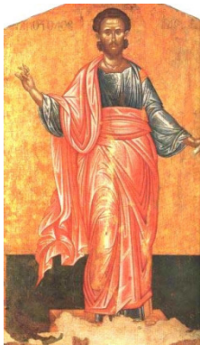
Sv. apoštol Jáson

Po Kerkyrinej smrti začal kráľ prenasledovať tých, ktorí uverili v Krista. Keďže pred ním utiekli na vedľajší ostrov, loďou sa vydal za nimi. Keď bol na otvorenom mori, strhla sa silná búrka a Kerkylinos v nej zahynul.