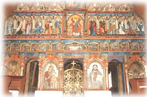
Foto: Obnovený exteriér chrámu a jeho ikonostas