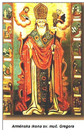
Arménska ikona sv. muč. Gregora

Pri príležitosti svojho triumfálneho návratu do arménskeho hlavného mesta Vagaršapatu však priniesol Trdat obety pohanským bohom, predovšetkým svojmu obľúbenému božstvu Anahit. Keď naliehal na Gregora, aby tiež obetoval bohom, on mu odpovedal, že ani v nebi ani na zemi niet Boha okrem Krista.