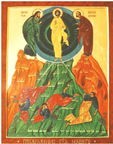
Ikona sviatku Premenenia Pána

Kde sa stala táto udalosť, nevieme. Tradícia hovorí, že to bolo na vrchu Tábor, ktorý sa týči priamo v srdci Galiley uprostred nížinatej krajiny. Stalo sa to zrejme v druhom roku Pánovho účinkovania (asi roku 29) medzi židovskými sviatkami Veľkej noci (alebo Turícami) a Sviatkami stánkov (por. Jn 5-7). Vrch Tábor bol zrejme veľmi vhodný na nerušenú meditáciu spojenie s Bohom. Tak ako kedysi Daniela ohromil zjav Božej slávy (Dan 10,6), tak aj apoštoli boli vo vytržení, Peter vyjadril túžbu zostať v takejto sláve, keď nevedomky hovorí: „Postavme tu tri stánky“. Spolu s Ježišom sa pri jeho premenení zjavili aj dve najväčšie postavy Starého zákona – Mojžiš a Eliáš. Symbolizujú celé Božie zjavenie v Starom zákone, ktoré sa teraz napĺňa a vrcholí v samotnom Ježišovi. Sám Boh Otec potvrdzuje tieto veci hlasom z neba: „Toto je môj milovaný Syn...“ Vtedy traja apoštoli padajú na zem, plní