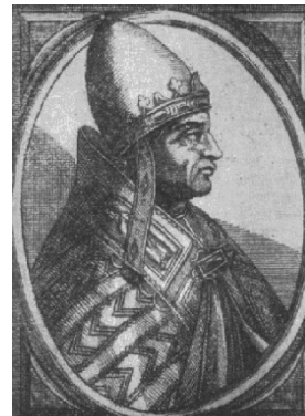
Pápež Gregor VIII.

Sviatok Premenenia Pána sa slávil v rôznych termínoch, pápež Kalixt III. v roku 1456