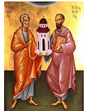
Sv. apoštoli Peter a Pavol

Svätý Pavol sa narodil okolo roku 10 v Tarze, ktorý bol dôležitým kultúrnym a obchodným strediskom v Malej Ázii. Pôvodne sa menoval Šavol. Študoval v Jeruzaleme a stal sa tu veľkým prenasledovateľom kresťanov. Na ceste do Damasku okolo roku 33-35 zjavil sa mu Ježiš Kristus. Pavol sa stal kresťanom a veľkým misionárom medzi pohanmi. Pôsobil na Cypre, v Malej Ázii, v Macedónii, v Grécku aj v Ríme. Pavol bol sťatý v Ríme roku 67 za cisára Nerona. Pochovaný je v bazilike sv. Pavla v Ríme postavenej v 4. storočí.