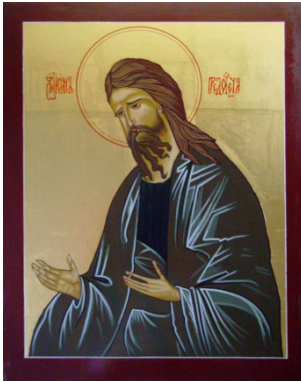
Sv. Ján Krstiteľ

Jeruzalema. Tu v chráme, oblečený do kňazského rúch, so zlatou kadidelnicou v ruke, vošiel za záves okadiť oltár. Ľud stál pred oponou a modlil sa k Pánu Bohu. Keď Zachariáš kadil oltár, zrazu na pravej strane oltára zbadal anjela a veľmi sa zľakol. No anjel sa k nemu ozval: „ Neboj sa, Zachariáš, lebo je vyslyšaná tvoja modlitba. Tvoja manželka Alžbeta ti porodí syna a dáš mu meno Ján. Budeš sa radovať a plesať a jeho narodenie poteší mnohých. Lebo on bude veľký pred Pánom. Víno a opojný nápoj piť nebude a už v matkinom lone ho naplní Duch Svätý. Mnohých synov Izraela obráti k Pánovi, ich Bohu. Sám pôjde pred ním s Eliášovým duchom a mocou, aby obrátil srdcia otcov k synom a neveriacich k múdrosti spravodlivých a pripravil Pánovi dokonalý ľud. “ 1