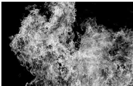
Kto sa s ohňom zahráva, popáli sa !