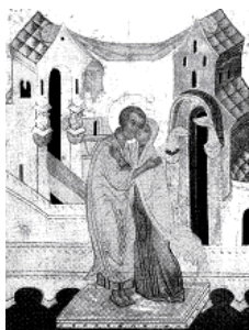
Sv. Joachim a Anna Ž 92, 14-16

Tí, čo vyrastajú v dome Pánovom, v nádvoriach nášho Boha budú prekviatať. Ešte aj v starobe budú prinášať ovocie, úrodní budú a plní sviežosti; a tak zvestujú, že Pán, moje útočisko je spravodlivý a nepravosť v ňom niet.