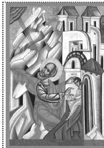
Eliáš s Elizeom

Syn Safatov, z Ruvinovho pokolenia mesta Avelmaula. Elizeus oral na svojom poli s dvanástimi pármí volov. Prišiel k nemu prorok Eliáš - Tesviťanin a hodil na neho svoj plášť. Elizeus nechal voly, išiel za Eliášom prosiac ho, aby sa