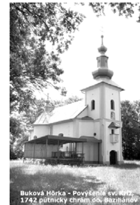
Buková Hôrka - Povýšenie sv. kríža 1792 pútnický chrám do Bazilhanov

Prosíme rodičov detí, ktoré sú zapísané na stretnutie gréckokatolíckej mládeže BYSTRÁ 2007, aby si prevzali podrobné informácie a tlačivá k potvrdeniu o zdravotnom stave dieťaťa, ktoré stačí vypísať a podpísať rodičom (nie lekárom).