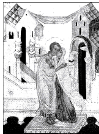
Sv. Joachim a Anna

Gréckokatolícka cirkev, Farnosť Povýšenia sv. Kríža, Prešov-Sekčov